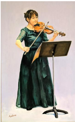
奏 油彩 P50

1974年、東京都に生まれる。主な作曲作品に『ソロマンドリンとマンドリンオーケストラのためのうたとおどり』シリーズや『Happy Happy』『Testamates』『Giocoso』などがあり、2018年2月に自身の作品展『至誠展』(アンサンブル・テスタ・カルドプロデュース)を開催する。また2019年にはリサイタル活動を再開し、『マンドリン現代音楽のタベ』や『カルロ・ムニエル作品集』といった特色のある公演を行う。2022年9月の『プロ生活20周年記念』のリサイタルでは、毎曲楽器を替えるリサイタルを、また2024年8月には前代未聞の6時間リサイタルを行うなど、精力的に演奏活動を行っている。なお2021年7月から毎月サロンコンサートを開催し、毎回趣向を凝らした内容で好評を博している。2011年7月、ドイツ・オットワイラーのマンドリン講習会にて指揮課程を修了。2020年、マンドリンのワンポイントアドバイス集『まいにちキソレン』、速弾き練習曲集『まいにちハヤビキ』を出版。好評発売中。現在、演奏活動の傍ら桜井マンドリン研究所を主宰し、後進の指導にあたっている。